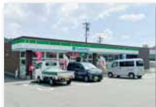
ファミリーマート