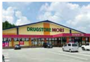
ドラッグストアモリ