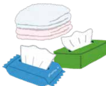
タオル・ティッシュ