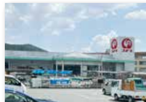
ホームセンターコメリ